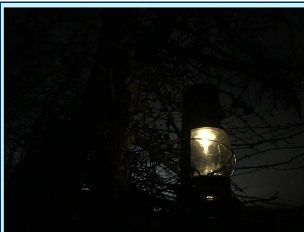
Foto:Flagermuslygte i skumring

Programblad Februar og Marts 2018 Nr. 1, årgang 1